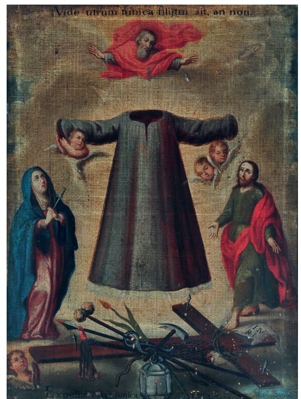
Ledesma (Nueva España, México)