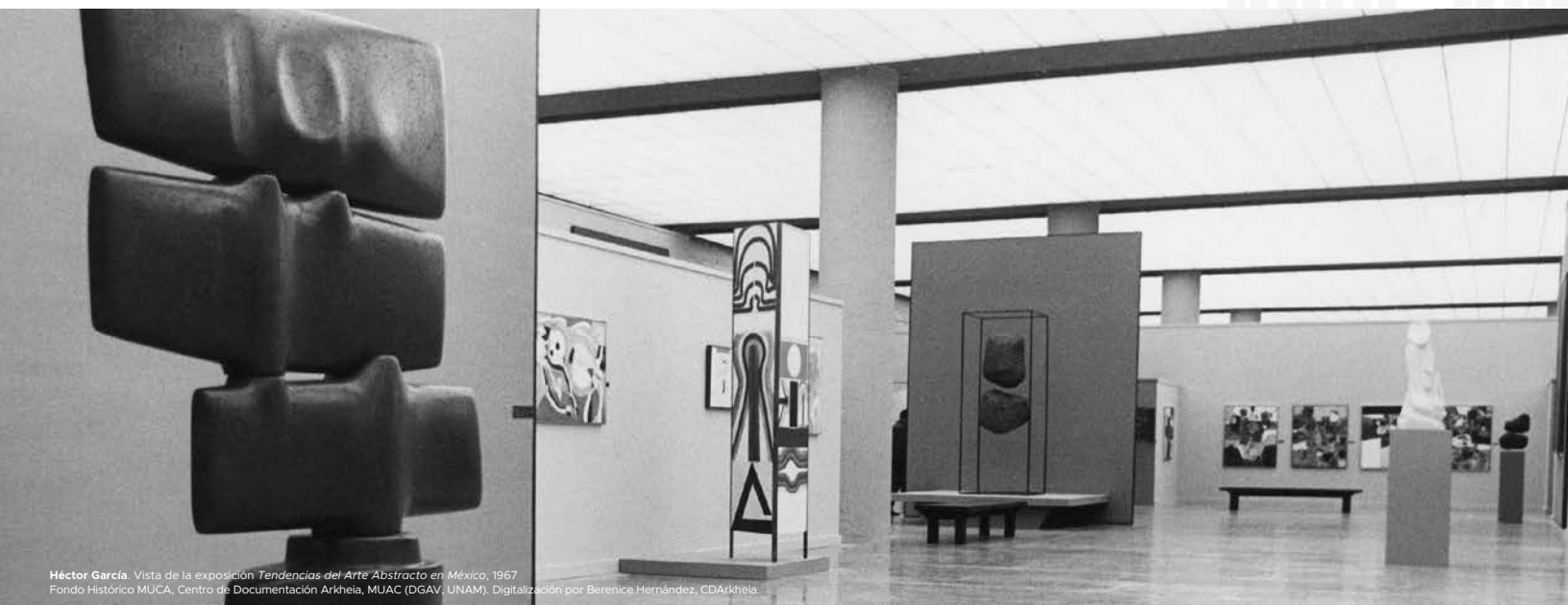
Héctor García. Vista de la exposición Tendencias del Arte Abstracto en México , 1967