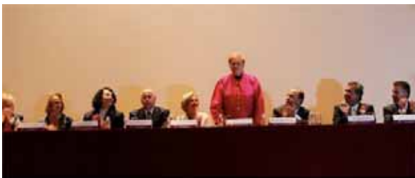
Mesa del presidio

The significance of “Civic and Social Infrastructure”, considered as an essential consequence of modernity, calls for the appraisal of the distinct circumstances in which these buildings came into being. We refer not only to the socio-political and economical framework, but also to the ideology of the designs and, most importantly, the urban significance of their